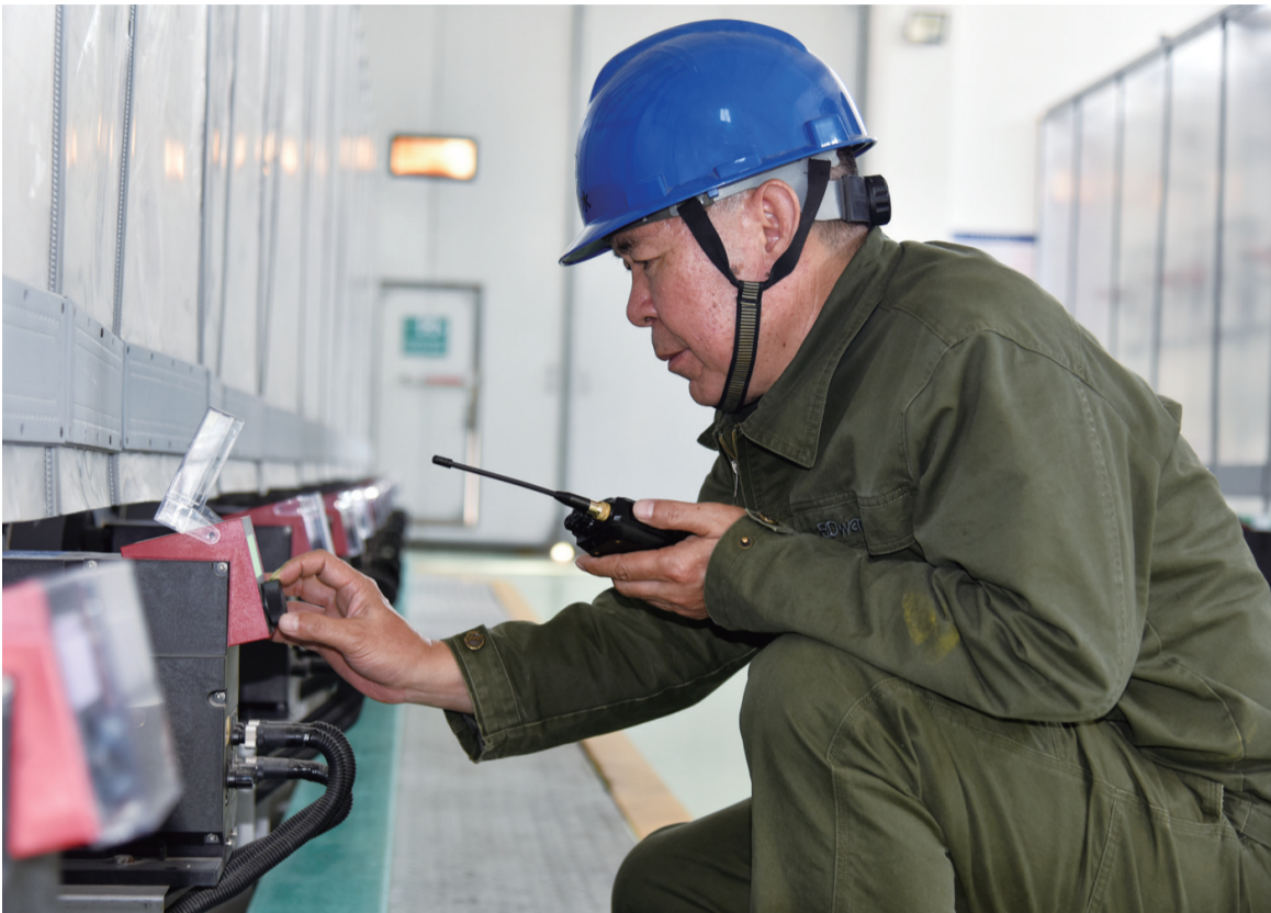
保定供水公司工作人员对加药设施进行定时巡检。