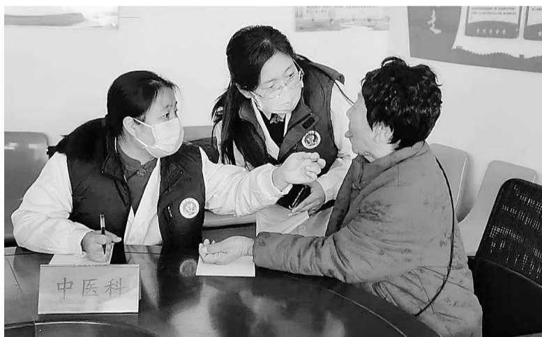
医务人员为群众提供专业的诊疗、用药指导。

现场,医护人员与志愿者各司其职、分工协作。医护人员为现场群众免费测量血压、血糖,进行心电图、彩超等基础检查,针对颈肩腰腿痛、高血压、糖尿病等常见多发病,耐心解答咨询,提供专业用药指导和健康干预建议,助力群众早发现、早关注健康隐患。中医及康复医学学科的医师们通过“望、闻、问、切”精准辨证,为群众量身定制康复方案,现场开展针刺、耳穴压豆、艾灸等中医适宜技术,还手把手示范颈椎操、腰背肌训练等实用康复动作,教会大家日常保健和康复技巧。“巡回医疗服务是推动优