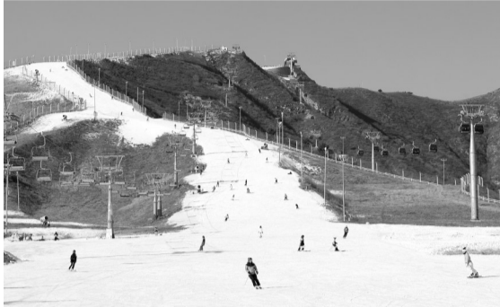
滑雪爱好者畅享冰雪运动的速度与激情。