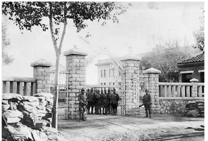
日军“花见部队”相册内的照片。