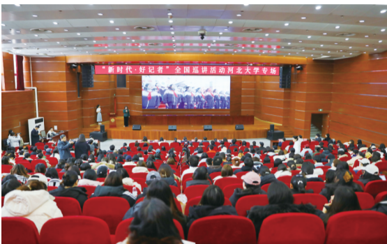
活动现场。

深地感受到作为一名记者的职业荣誉感:“今年,我的同事霍碧莹参赛,并获得全国第十二届‘好记者讲好故事’活动十佳选手,成为本届河北省唯一获此殊荣的新闻工作者。同事的拼搏进取也在激励我们,弘扬敬业精神才能践行‘四力’,成为无愧于时代的优秀新闻人。”