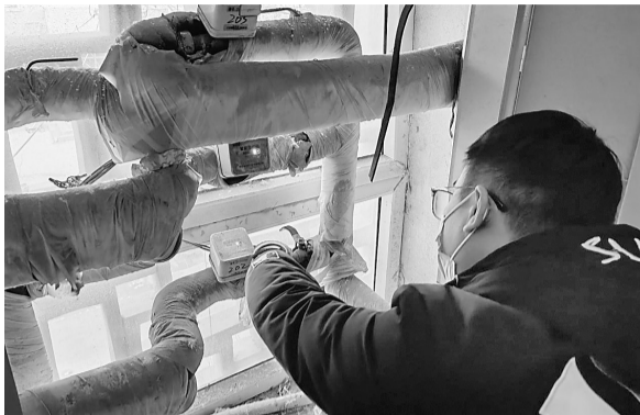
供热技术人员正在给管道进行放气处理。

17日上午,供热站管网定压循环恢复正常后,针对网格群内反馈暖气不热的住户,供热公司紧急调派多名维修人