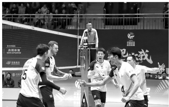
保定沃隶男排队员庆祝得分。