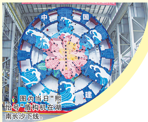
图为当日“熙怡号”盾构机在湖南长沙下线。