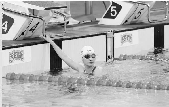
2025年11月10日，第十五届全国运动会女子400米自由泳决赛中，河北队选手、保定籍运动员李冰洁以4分01秒17的成绩获得金牌。

“我在东京拿了比较不错的成绩，所以去巴黎我有更高的目标。可能因为前期训练上的一些问题，包括伤