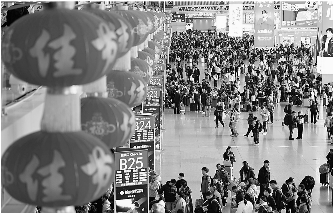
2026年2月2日,旅客在广州南站进站乘车。

早年间,部分技术公司开发出简单的抢票辅助工具,以刷新脚本、浏览器插件为主,传播范围也有限。后来,部分浏览器推出抢票工具,一些平台推出“付费加速包”,开启抢票软件的智能化、商业化路子,多个第三方平台投身其中。