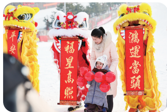
▲在河北省石家庄市鹿泉区西部长青滑雪场,游客与舞狮队合影。