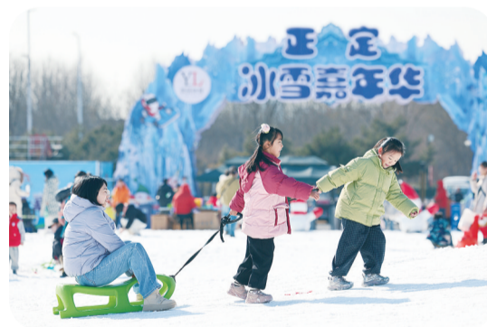
▲小朋友们在河北省石家庄市正定冰雪嘉年华玩耍。