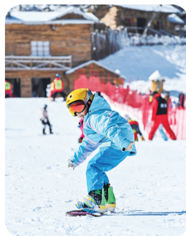
◀在江西省宜春市铜鼓县排埠镇七星岭滑雪场,参加冰雪冬令营的学生在练习滑雪技巧。