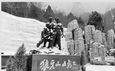
狼牙山英雄纪念广场。