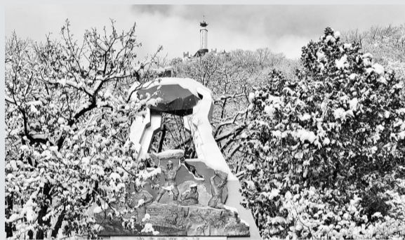
棋盘陀阻击战遗址。