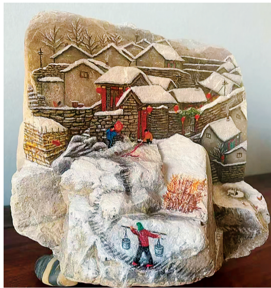
小时候的年。(石画) 杨丽作

贴春联是我最爱的过年仪式。我端着浆糊跟在爹身后，看春联贴上木门，“天增岁月人增寿，春满乾坤福满门”。红纸黑字，墨香混着浆糊的麦香，一句句吉祥话就这样被郑重地请上楣，也刻进了我心里。