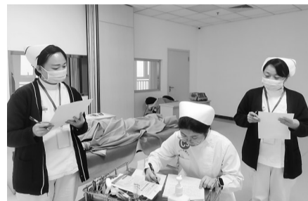
比赛现场。