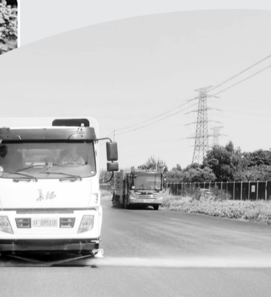
◀2024年7月,凉城涿源,白石山下,保定市首批氢能环卫车惊艳亮相。

稳步推进,亮城丽都正以实干与创新,全力打造可复制、可推广的氢能环卫“保定模式”,为绿色城市发展提供鲜活样板。