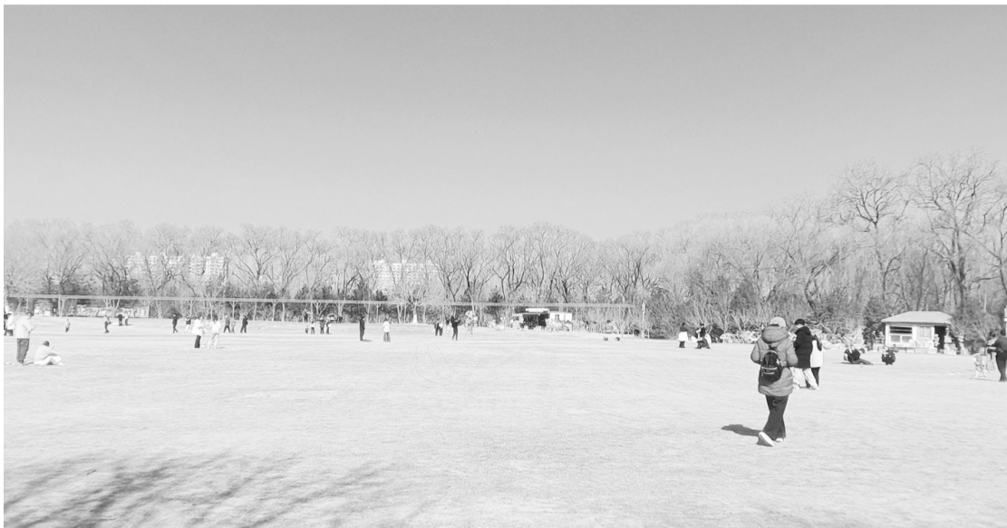
生态园草坪上,不少市民休闲游玩,享受户外时光。