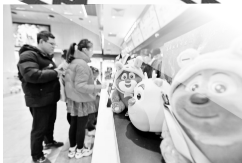
2月20日,在浙江嘉兴南湖嘉影银河影城,观众购票准备观影。